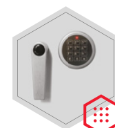
zamek elektroniczny Solar Basic