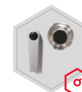
mechaniczny zamek szyfrowy