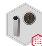
zamek elektroniczny Solar Business