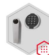
zamek elektroniczny Primor 3000 level 5