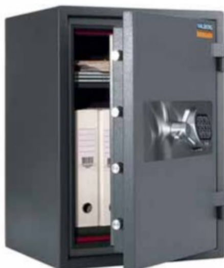
PROTECTOR PLUS 65