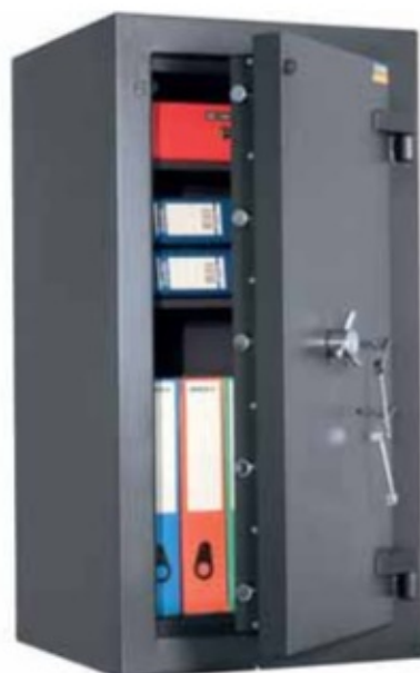
PROTECTOR PLUS 99